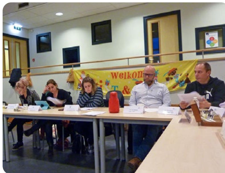
Quickstartbijeenkomst op 26 november 2018: Goede medezeggenschap, dat doe je zo.

Vanwege het geringe aantal reacties en vanwege het lage aantal expliciet negatieve reacties, kan geconcludeerd worden dat ouders geen zwaarwegende bezwaren hebben tegen de voorgenomen fusie. Het is de intentie van het bestuur om de fusie tussen OPSO en SPOOR voor het zomerreces van 2020 te laten plaatsvinden. ●