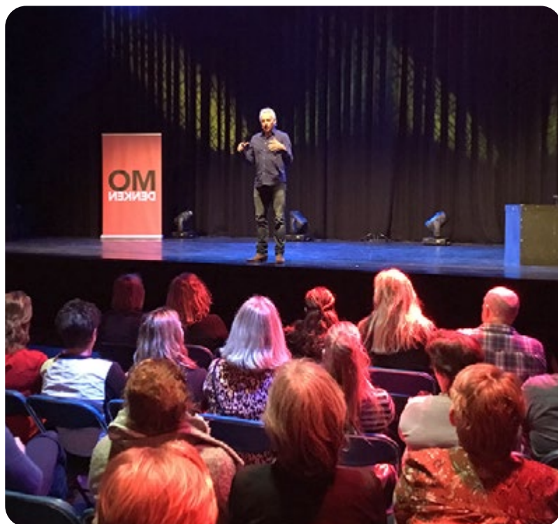
De Omdenkshow tijdens de Achterbanbijeenkomst

kon twee sessies bijwonen. Deelnemers gaven aan dat ze de tijd te kort vonden om alles door te spreken; daarom is de gelegenheid geboden om op 13 mei door te praten.